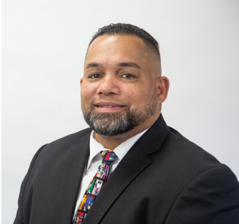
DR. JAVIER MONTAÑEZ អគ្គិយសនាយកក្រសួង

ស្នើសុំកុំភ័យខ្លាចចំពោះការកែប្រែសាលារៀនរបស់យើង! យើងកំពុងយកចិត្តទុកដាក់លើការកែប្រែសាលារៀនដើម្បីឱ្យសិស្សរបស់យើងទទួលបានការសិក្សាដែលល្អបំផុត។ សប្តាហ៍នេះ យើងមានចំណុចព័ត៌មានមួយចំនួនអំពី បុរេតិច្ឆនវាយតម្លៃទូលំទូលាយ (RICAS) របស់ Rhode Island ឆ្នាំ 2023 ពីនាយកដ្ឋានអប់រំ Rhode Island (RIDE)។ សិស្សសុំចុះឈ្មោះទី 3 ដល់ទី 8 ឆ្នាំសិក្សា RICAS ប្រចាំឆ្នាំចាប់ពីខែមីនា ដល់ខែឧសភា។